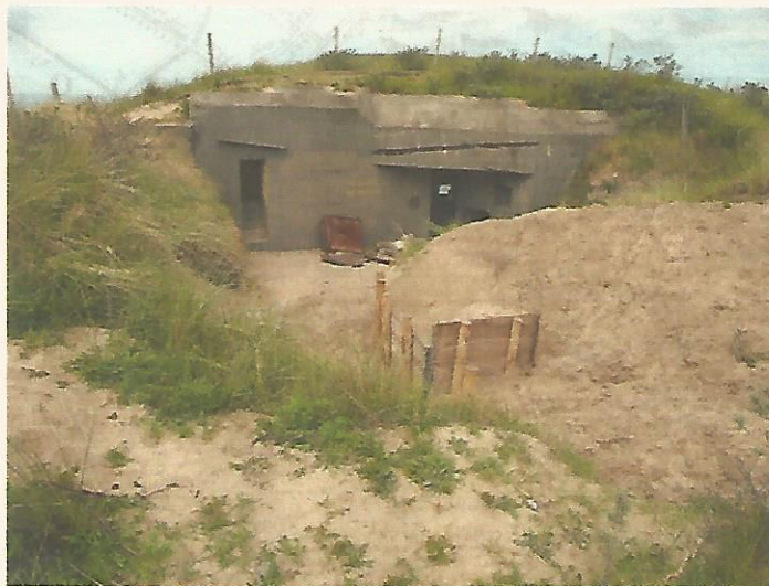
Mammut radar Wijk aan Zee

Locatie: Dorpscentrum De Blinkerd, Heereweg 150, Schoorl