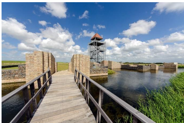
vanaf de toren heb je fraai uitzicht over de omgeving en de Omringdijk

Het adres van het museum is Kerkweg 5, 1744 JD Eenigenburg. ( Sint Maarten )