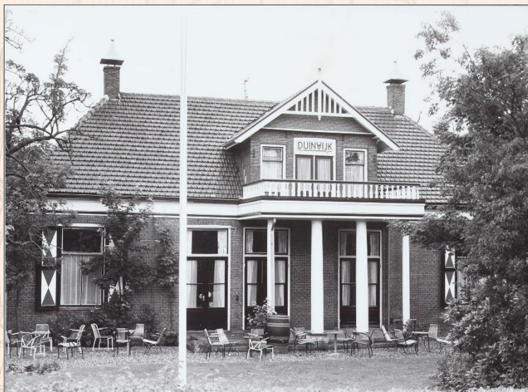
FO 201784

Rondleiding in de burgemeesterswoning Duinwijk aan de Binnenweg 6 in Schoorl op zaterdag 14 september 2024